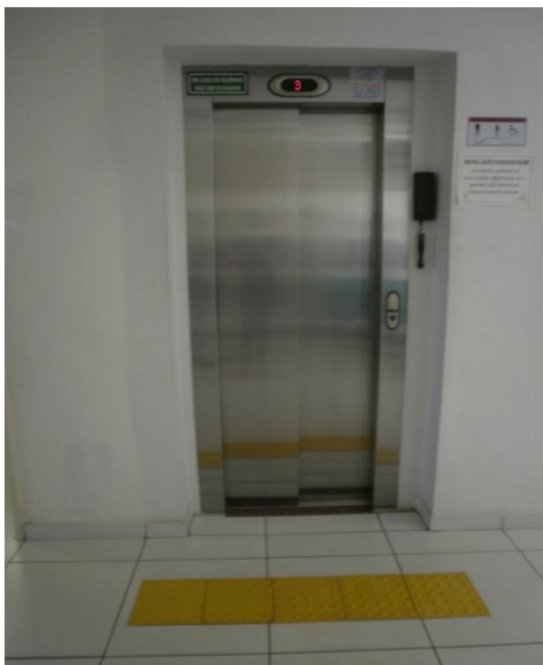
Figura 03: Elevador exclusivo para pessoas com necessidades especiais ou deficientes,

Figura 02: Piso Tátil e Estacionamento exclusivo para deficientes físicos, conforme Art. 26: Nas edificações de uso público ou de uso coletivo, é obrigatória a existência de sinalização visual e tátil para orientação de pessoas portadoras de deficiência auditiva e visual, em conformidade com as normas técnicas de acessibilidade da ABNT.