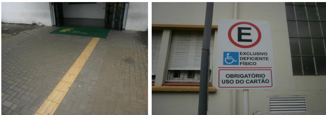
Figura 02: Piso Tátil e Estacionamento exclusivo para deficientes físicos, conforme Art. 26: Nas edificações de uso público ou de uso coletivo, é obrigatória a existência de sinalização visual e tátil para orientação de pessoas portadoras de deficiência auditiva e visual, em conformidade com as normas técnicas de acessibilidade da ABNT.

Figura 01: Caixa eletrônico e telefone público adaptado para deficientes, conforme Art. 16: § 3º As botoeiras e demais sistemas de acionamento dos terminais de autoatendimento de produtos e serviços e outros equipamentos em que haja interação com o público devem estar localizados em altura que possibilite o manuseio por pessoas em cadeira de rodas e possuir mecanismos para utilização autônoma por pessoas portadoras de deficiência visual e auditiva, conforme padrões estabelecidos nas normas técnicas de acessibilidade da ABNT.