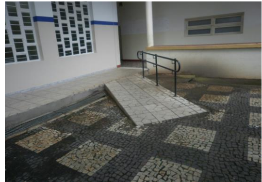
Figura 05: Rampas com piso tátil e corrimão

De acordo com o item instalação de piso tátil direcional e de alerta junto às portas dos elevadores, em cor contrastante com a do piso, com largura entre 0,25 m a 0,60 m, afastada de 0,32 m no máximo da alvenaria, pode-se verificar na Figura 06 a instalação dos mesmos.