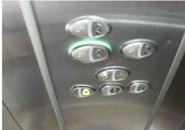
Figura 04: Elevador com botoeiras em braile, conforme Art. 27, 2º Junto às botoeiras externas do elevador, deverá estar sinalizado em braile em qual andar da edificação a pessoa se encontra.

conforme Art. 27: A instalação de novos elevadores ou sua adaptação em edificações de uso público ou de uso coletivo, bem assim a instalação em edificação de uso privado multifamiliar a ser construída, na qual haja obrigatoriedade da presença de elevadores, deve atender aos padrões das normas técnicas de acessibilidade da ABNT.