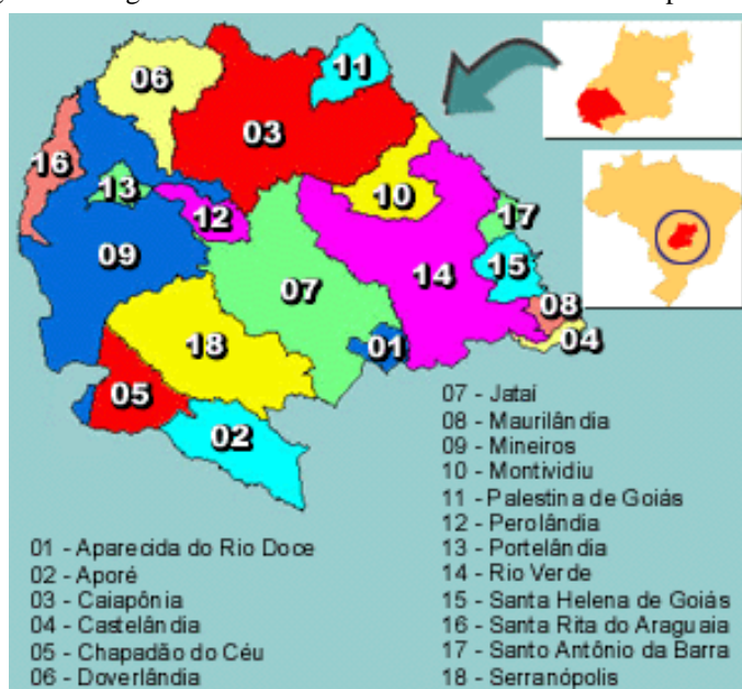
Figura 1 – Região Sudoeste Goiano onde se insere o município de Jataí

A observação da malha viária confirma esta articulação do município, um entroncamento rodoviário que se articula com o norte do Estado (BR 158), o sul (GO 184), o leste (BR 060) e o oeste (BR 364) em direção à hidrovía Paranaíba-Paraná-Tietê (Figura 2).